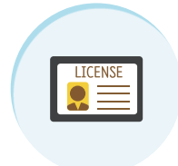
기술자격 및 취업 훈련비